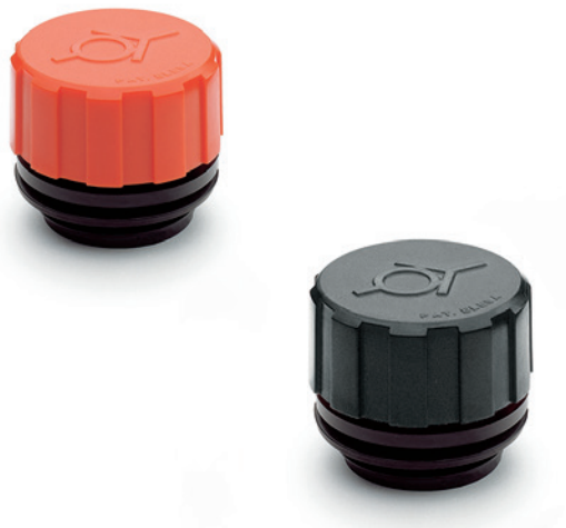
ELESA Original design

Odvzdušňovací zátky s ventilem SFV. jsou vhodné pro všechny tyto aplikace (převodovky, variátory nebo kompresory), kde vnitřní tlak vzduchu nesmí překročit určitou hodnotu (10 nebo 100 mb). V těchto případech bezpečnostní ventil zátky umožní vytlačení přebytečného vzduchu z nádrže a tím se dosáhne uvnitř nádrže hodnoty tlaku, na který je ventil nastavený. Těsnicí disk (uzavřený při normálních tlakových podmínkách) zabraňuje vnikání prachu a unikání oleje.