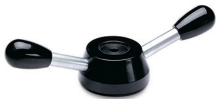
ELESA Original design

Axiální zajišťovací podložka, typ GN 184 (viz. strana 971).