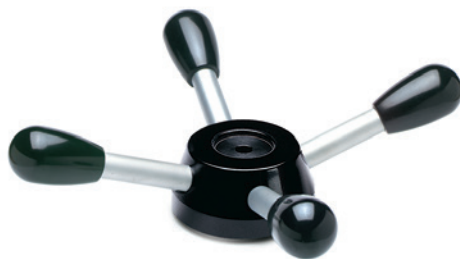
ELESA Original design

Axiální zajišťovací podložka, typ GN 184 (viz. strana 971).